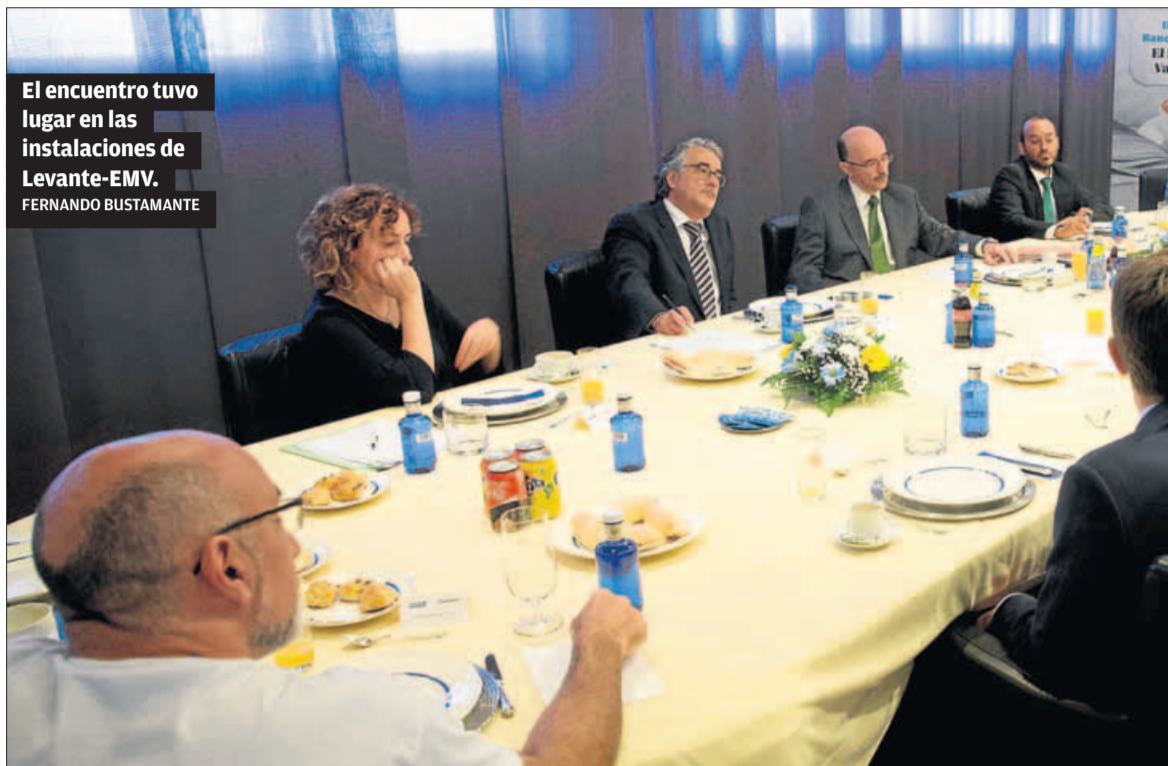
El encuentro tuvo lugar en las instalaciones de Levante-EMV.

Los expertos reclaman una legislación estable para que la instalación de plantas fotovoltaicas y eólicas se consolide en la Comunitat Valenciana como alternativa sostenible